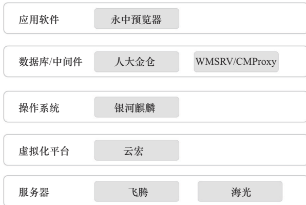
图2 信创电子邮件系统架构

根据以上的部件设计, 形成最终的全栈式电子邮件系统替代方案, 其架构如图 2 所示。