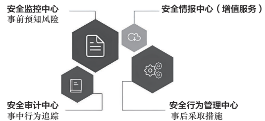
图3 邮件系统威胁情报

7) 威胁情报: 邮件系统标准配备安全数据运营平台 (SMC) 应用程序接口 (API), 可与第三方安全产品对接, 将威胁情报、态势感知、云安全、统一认证、安全大数据分析等安全能力平台化, 从不同维度对安全数据进行深加工, 并以 API 方式对外提供能力, 如图 3 所示。