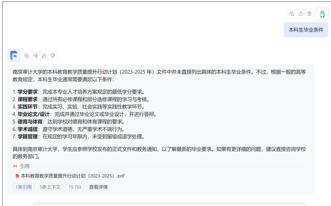
图 3 网页交互

通过对后台分析和问卷调查、访谈等，师生对 AI 服务平台满意度较高，认为其优势一是相对于传统人工服务平台响应速度更快，二是对它能够提供引用来源便于后续扩展阅读的功能非常满意。