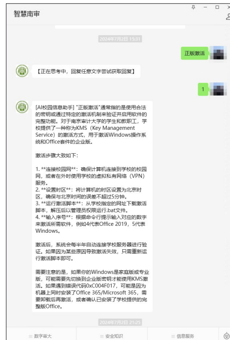
图 2 微信交互

经过一段时间的调试和推广测试,系统目前已经在校内正式推出并接入了公众号以及建设了网站平台,如图 2 和图 3 所示。