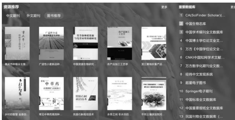
图3 文献资源推荐结果