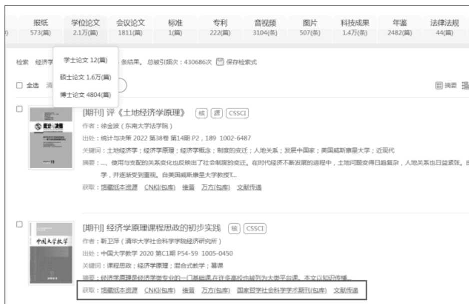
图2 整合不同数据库形成的资源库

图 2 中展示了与经济学原理相关的文献资源,可看出经济学原理相关资源的获取方式,分别是馆藏纸质资源、CNKI、维普、万方、国家哲学社会科学学术期刊数据库。系统试运行 1 个月后,平台汇总了 142 万条文献资源,累计访问量达 25 余万次,师生使用人数达到 1800 人。为了展示推荐效果,本文以农学院某教师为例,其使用平台 1 个月后的文献资源推荐结果如图 3 所示。该教师研究方向为作物高产高效优质栽培,杂粮品质栽培生理生态、育种及产业化,发表过小麦种植、不同肥料对作物影响方面的论文,承担过“植物生产学”“作物栽培学”“农业资源利用与区划”“农业推广学”