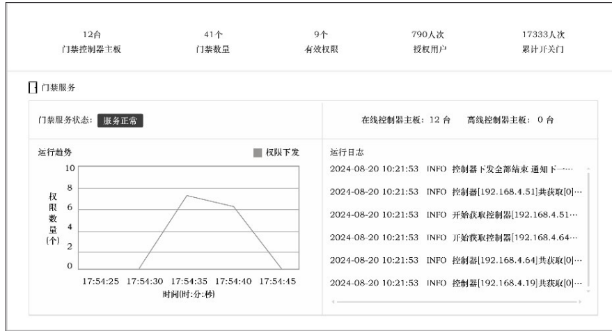
图3 门禁权限同步可视化