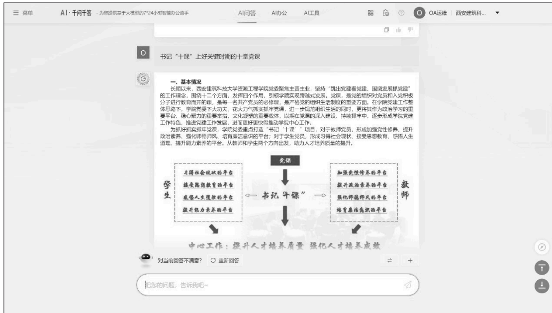
图4 党课学习AI“千问千答”