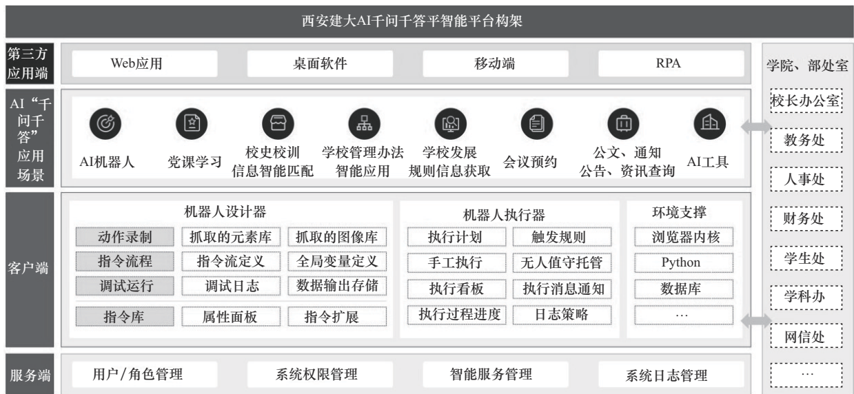
图2 AI“千问千答”智能平台整体架构